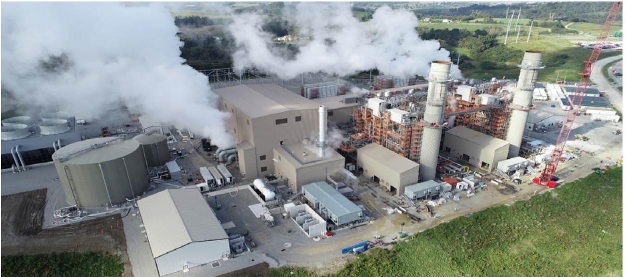
Westmoreland Generating Station, Smithton, Pennsylvania

Como líder mundial, nuestros clientes dependen de nosotros para aplicar de forma creativa tecnología avanzada a todo tipo de aplicaciones de generación de energía. Trabajamos con los OEM para integrar los avances tecnológicos más recientes, como un mayor uso de hidrógeno, GLP y combustibles RNG para cumplir con los objetivos de sustentabilidad a largo plazo.